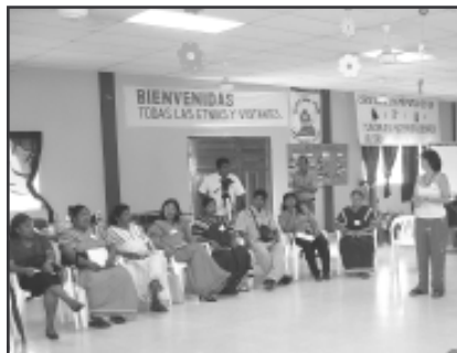
Día Mundial de la Mujer Rural: Artesanas de Bocas