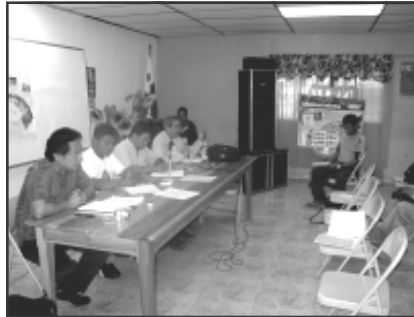
Foro Indígena Ambiente y Recursos Hídricos

Proyecto 2005-17. Apoyo al proyecto provincial de desechos sólidos, responsable: ADESBO.